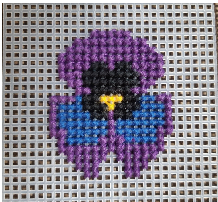
Рисунок 1. Готовая вышивка «Фиалка»