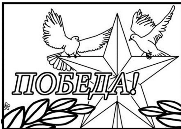
Рисунок 1. Готовая композиция